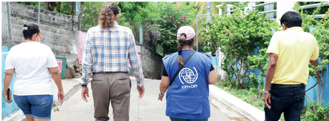
REUNIÓN CON LIDERESAS Y LÍDERES COMUNITARIOS EN MEANGUERA DEL GOLFO, LA UNIÓN, EL SALVADOR.

Como organización intergubernamental líder en el campo de la migración, la Organización Internacional para las Migraciones (OIM) promueve la migración segura, ordenada y regular al proporcionar servicios y asesoramiento a los gobiernos y migrantes desde una perspectiva integral y holística. Establecida en 1951, la OIM ha trabajado de cerca con las Naciones Unidas y otras partes interesadas claves desde su fundación, tanto a nivel operacional como a nivel de políticas públicas. En septiembre de 2016, la OIM se unió al SNU, convirtiéndose en la Agencia de las Naciones Unidas para la Migración, como un reconocimiento a sus acciones indispensables en el campo de la movilidad humana, lo que permitió su participación en el Grupo de Desarrollo Sostenible de las Naciones Unidas. La OIM cuenta ahora con más de 170 Estados Miembros, oficinas en más de 400 lugares sobre el terreno y más de 20.000 funcionarios, de los cuales el noventa por ciento trabaja en el terreno.