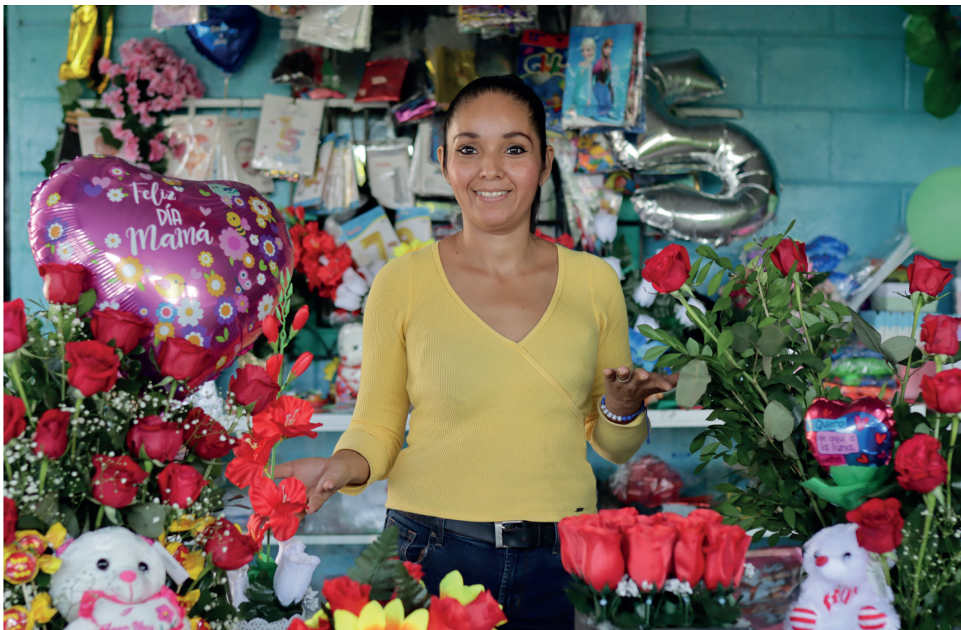
PARTICIPANTE DEL PROYECTO ENFOCADO EN FACILITAR LA REINTEGRACIÓN DE PERSONAS MIGRANTES RETORNADAS.